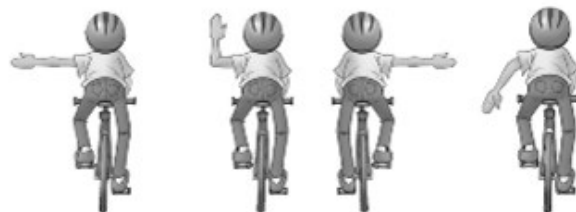
Tourner à gauche